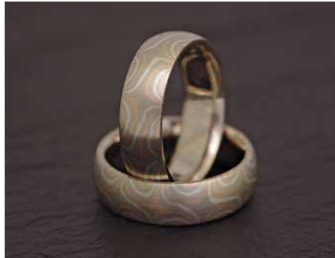
TRAURINGE Palladium, Rotgold und Silber Sternenmuster