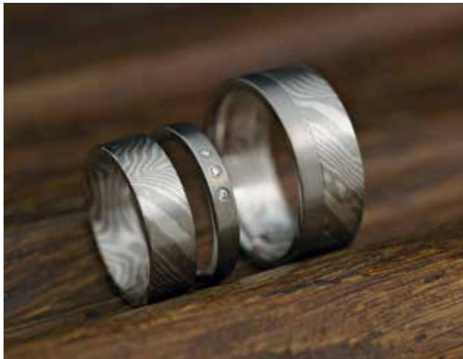
TRAURINGE Palladium und Silber Starke Tordierung Separater Diamantring