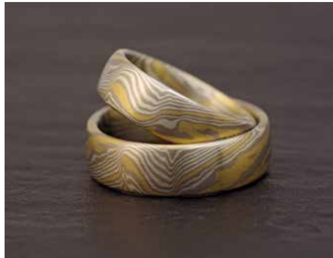
TRAURINGE Palladium, Silber und Gelbgold Mittlere Tordierung