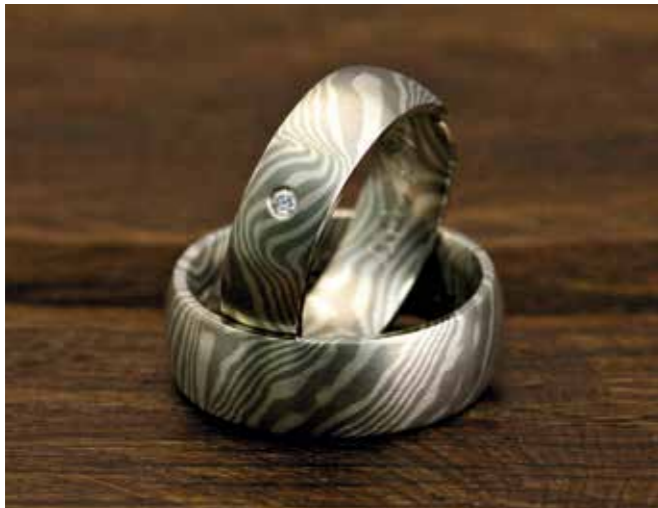
TRAURINGE Palladium und Silber Starke Tordierung